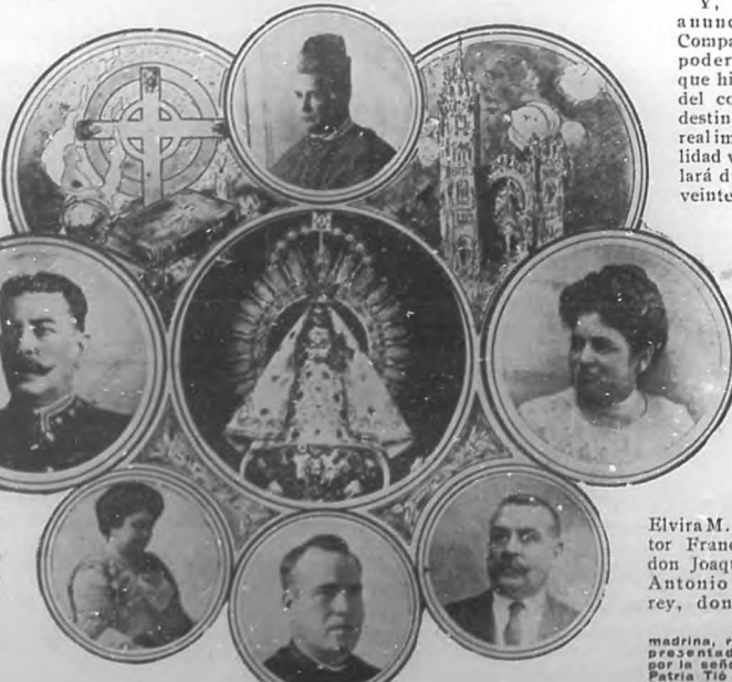
El festival de mañana con motivo de la colocación y bendición de la primera piedra del templo de la Caridad del Cobre. — Ilimo, señor Obispo de la diócesis. — Mayor General José Miguel Gómez, padrino; señora América Arias de Gómez

Muy sencillo: porque queremos que sean una sorpresa para todos durante la simpática fiesta-reparto de premios que estamos organizando y que se celebrará el día quince en el local que por la prensa se