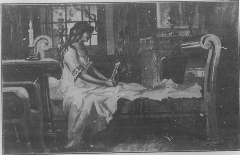
Devotamente recogida, con mayor fervor si cabe que los días anteriores, Conchita terminó su plegaria nocturna... (Ilustraciones de Teodoro Zapata.)

También ella desde entonces, llevó una vida bastante parecida á la monacal, pues salvo para asistir á los santos Oficios cotidianos, no salía para nada de su casa.