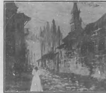
En uno de los barrios apartados de la Ciudad, alzabase magestuoso aunque de severa sencillez, el Convento-Iglesia de las Rvdas. M.M. Carmelitas... (Ilustración de Teodoro Zapata.)

—Su caso, hermana, no es nuevo. Dios Nuestro Señor mismo, permite á veces ciertos acontecimientos para dirigir á sus criaturas por el camino que de toda una eternidad les tiene señalado... Ya que usted tantos engaños ha recibido de este mundo, y el último parece ser una indicación de su destino, decídase de una vez en dejarlo... Su corazón solo encontrará el consuelo por que suspira, entregándose completamente en brazos del