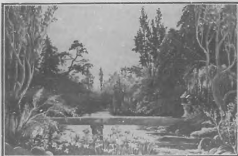
PAISAJE JAPONÉS.—Boceto de Decoración.

Los muebles, los detalles del hogar lo mismo, el decoro