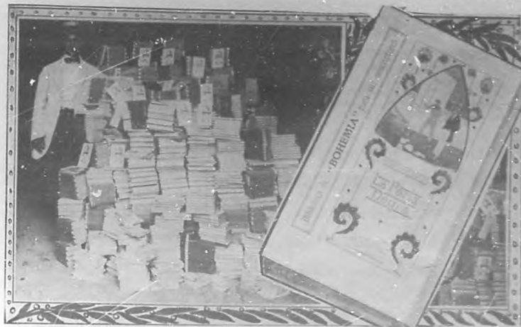
NUESTROS REGALOS. — La novela mensual para nuestros suscriptores. Facsimil de "La Perla Negra" que se reparte en este mes. Los 9.500 ejemplares de la novela, recibidos en nuestra Administración.