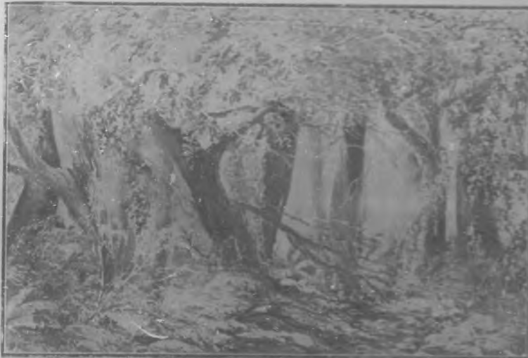
Boceto de una decoración de sala.

alma, no más que el alma, es lo que hace al artista.