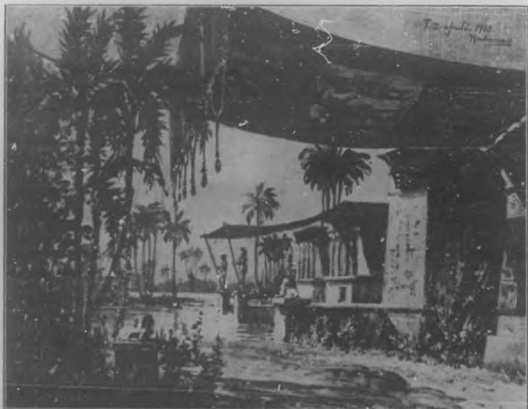
EL NILO.—Boceto del cuadro cuarto de la Corte de Carón.

Los vestidos, si son antiguos, arjé tanse en absoluto á los docu-